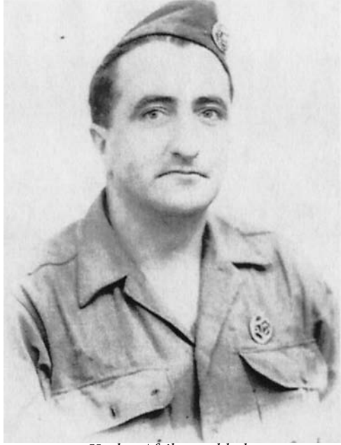
Xarlex Afrikan soldado